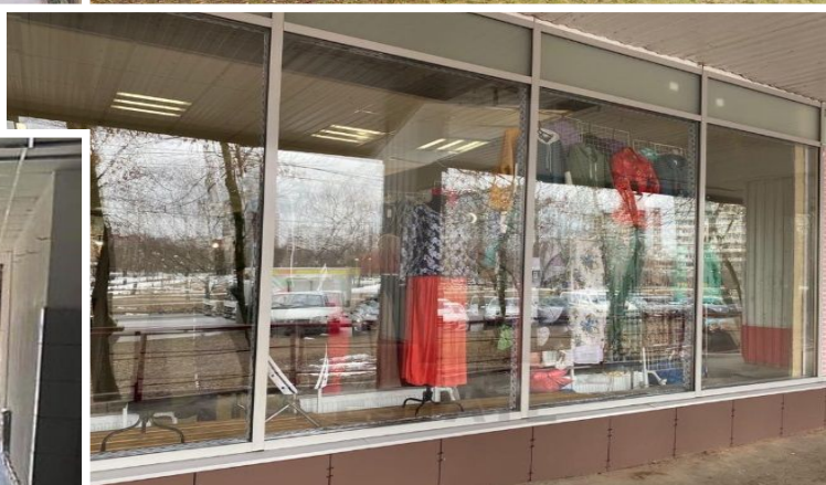
Торговое помещение 252,1 кв.м. Блок 1.