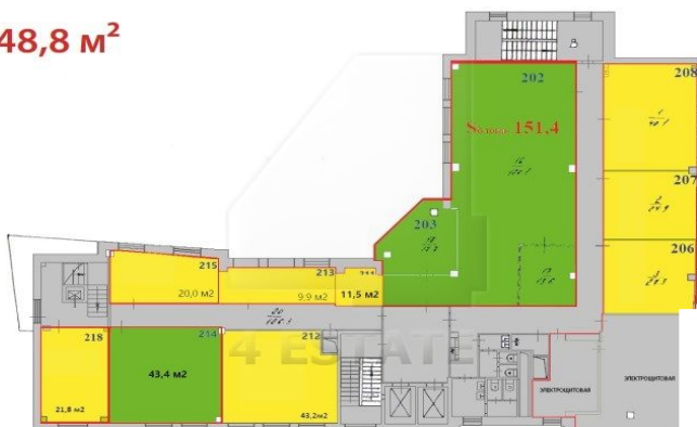
ПЛАНИРОВКИ. 3 ЭТАЖ