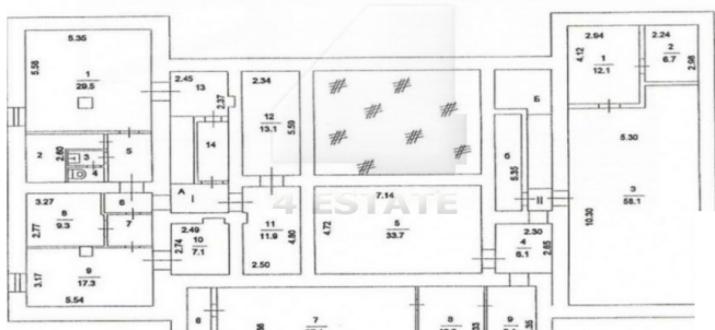
2 й этаж