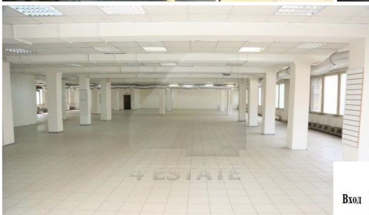
Офис 99,5 кв.м.